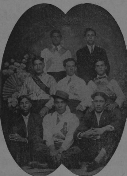
Grupo de jóvenes heredianos que participaron en las carreras de cintas del 12 de corrientes en Heredia, y que están dispuestos á participar también en las que se verán celebradas en las próximas fiestas cívicas de esta capital.